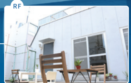
屋上ラウンジ Rooftop lounge 天台活动区