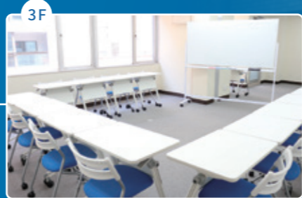
教室 Class room 教室