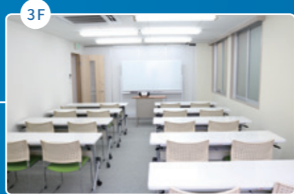
教室 Class room 教室