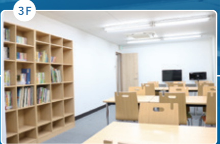
図書室 Library 图书室