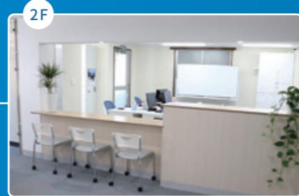
事務所・受付 Office and reception desk 办公室 / 接待处